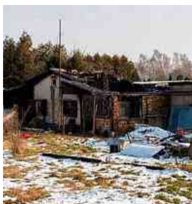
Diese Laube der Anlage „Am Busch“ ist komplett zerstört worden.

WOLFEN/MZ/MM - Eine Laube ist in der Gartenanlage „Am Busch“ in Wolfen niedergebrannt. Das Feuer brach vermutlich zwischen Montag und Freitag aus. Nach MZ-Informationen konnte der Vorstand bei einem letzten Rundgang am Montag noch keine Un-