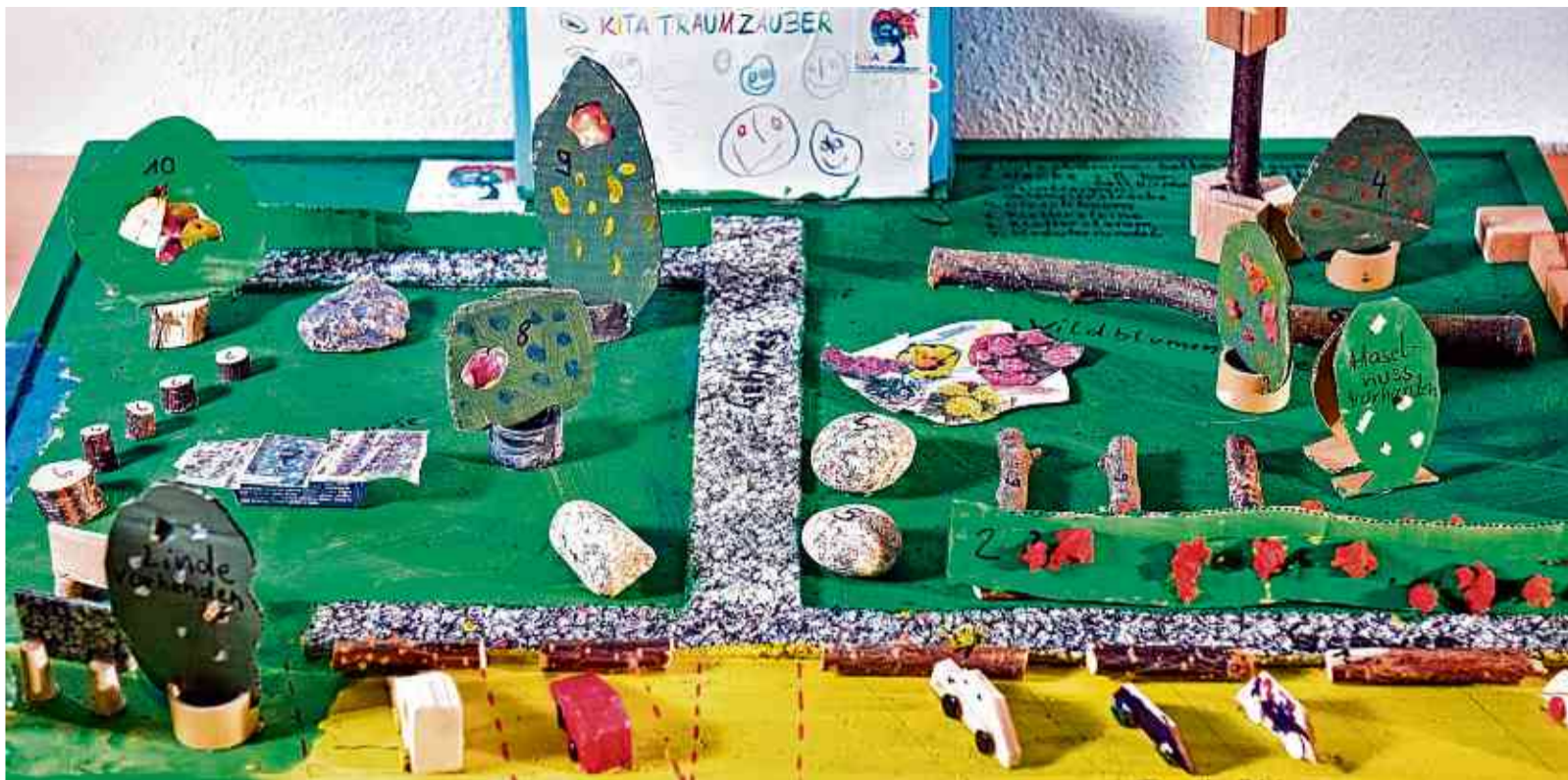
Kinder und Erzieher der Kita „Traumzauberbaum“ in Bitterfeld wünschen sich mehr Grün an der Einrichtung. Es ist eine der Ideen des Wettbewerbs „Jugendwerk.Stadt“, die derzeit im Frauenzentrum in Wolfen zu sehen sind.